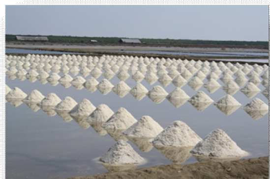
Brighten White Salt Road